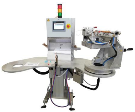
Table robuste en aluminium Colonne élévatrice pour mise à hauteur des postes Écran de contrôle tactile